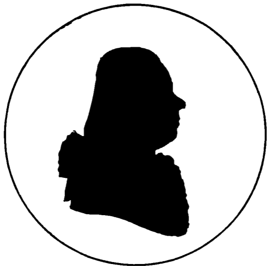
Степанъ Яковлевичъ Румовскій.