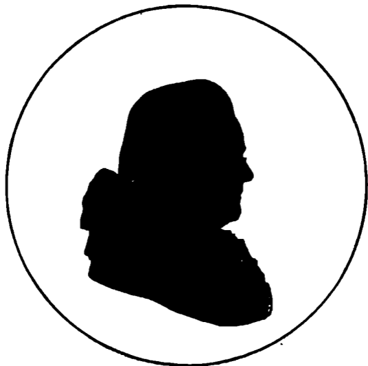
Яковъ Яковлевичъ Штелинъ.