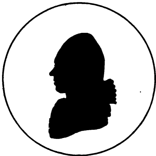
Петръ Симоновичъ Палласъ.