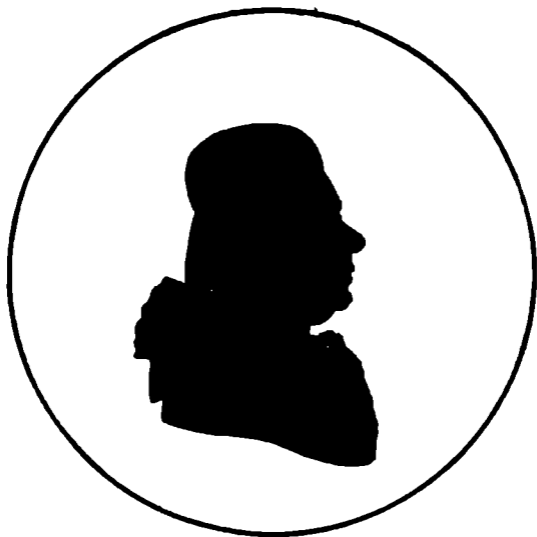
Иванъ Ивановичъ Лепехинъ.